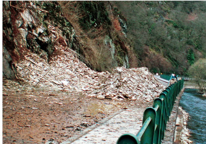
Erdrutsche – wie hier zwischen Bettel und Vianden – sind in Luxemburg eher selten

Die jetzt vorgestellte Karte zeigt im Maßstab 1:25 000 die geologische Beschaffenheit des Kantons Redingen